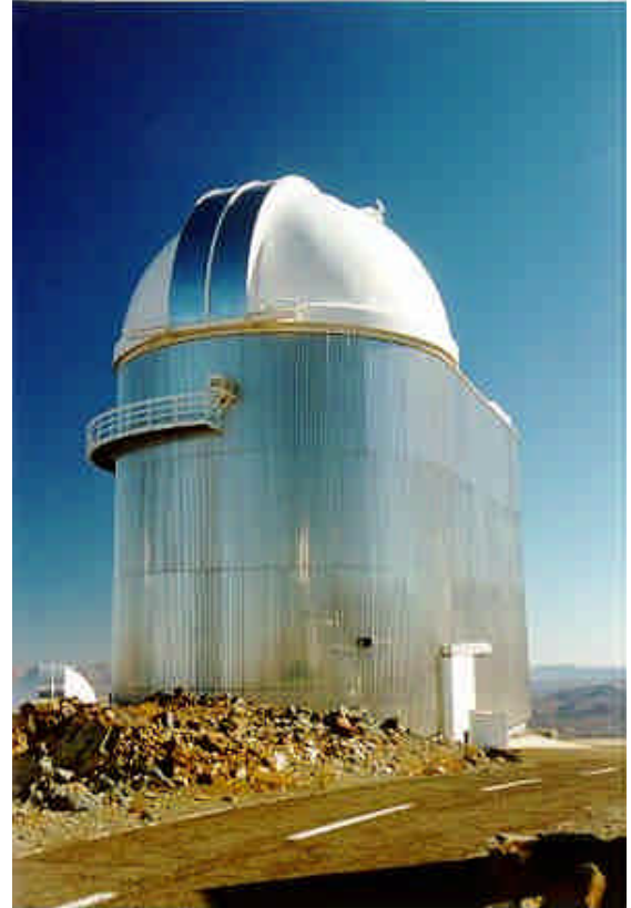
Télescope ESO de 1,5 m

Avertir le directeur de la Silla et le responsable du service technique de nos intentions et de la date choisie pour ces opérations.